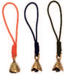
サビ朱 紺 抹茶