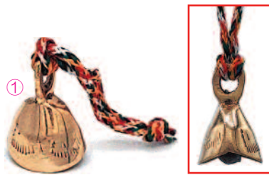
①真鍮ベル・Sサイズ ¥300 W 25 / H 33 / D 21mm