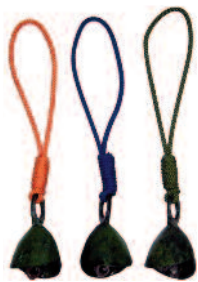
サビ朱 紺 抹茶